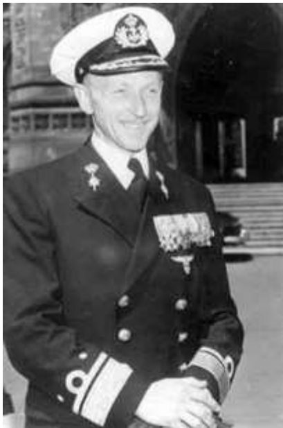
Schout-bij-nacht vlieger KM

Een bijzonder leven, dat zonder groeispurt zomaar heel anders had kunnen verlopen, en dat louter met vooropleiding van hbs-b, zeevaartschool, vliegopleiding en waarnemeropleiding KM. De rest geleerd met zijn vele talenten in de praktijk van het leven