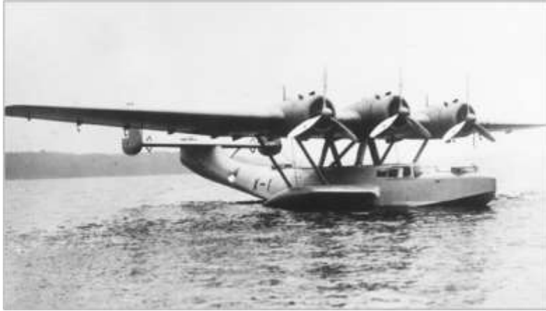
de MLD-Dornier 24 nummer X1

De vliegjaren vinden voor Schaper in redelijke rust plaats. In tegenstelling tot een paar collega's zoekt hij de lokale pers, journalisten en redacteuren, niet op. Hij maakt geen spectaculaire uitstappen. Wel is hij veel op pad om met de vliegboten te patrouilleren, visserijinspectie te doen, op zoek te gaan naar piraten, het uit de lucht in kaart brengen van obstakels en ondieptes, boordvliegoperaties en geschikte plaatsen te vinden, waar de MLD zijn watervliegtuigen zou kunnen verspreiden en verstoppen bij oorlogsomstandigheden. Daarnaast gaf hij vlieg instructie aan jonge vliegers en 'omscholers'. Hij deed gewoon rustig zijn werk en gaf pas in 1938 een eerste interview aan de lokale kranten. Reden is de komst van de eerste twee Dorniers 24 vliegboten, met nummer X1 en X2.