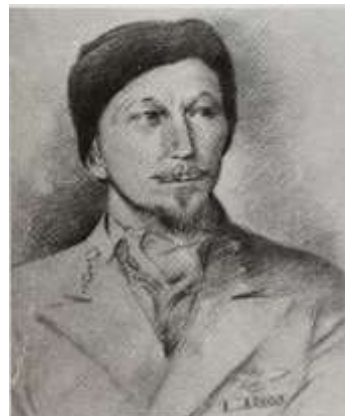
'Oorlogsvlieger van Oranje'