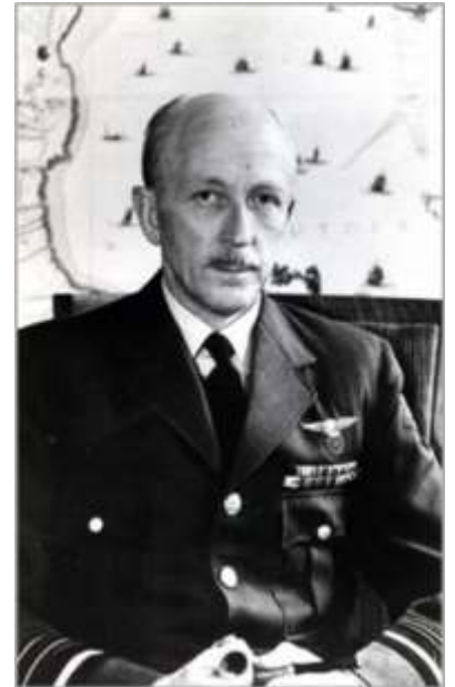
Luitenant-generaal vlieger Klu