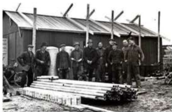
Arbeiders poseren voor een nog onvoltooide keet.

'Bouwen zonder scrupules. De Nederlandse bouwwereld 1940-1950' is verschenen bij WBooks.