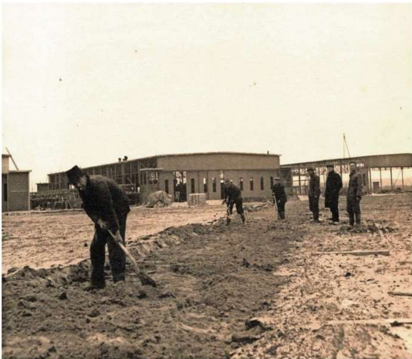
Arbeiders scheppen een leidingsleuf dicht op het terrein voor drie hangars in aanbouw.