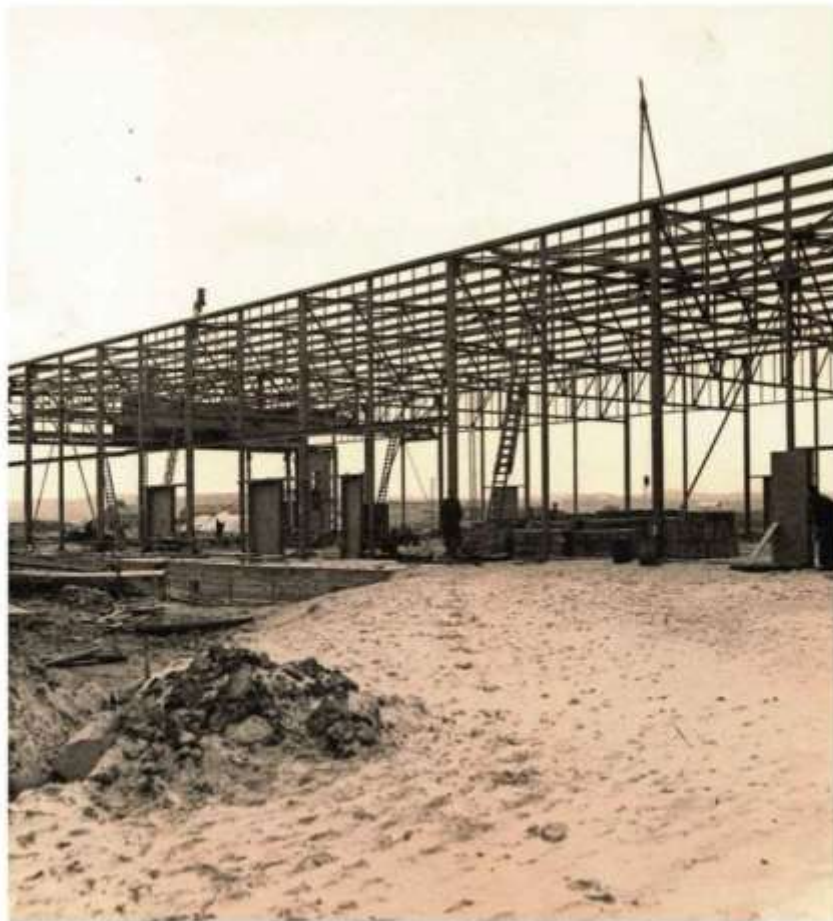
Stalen skelet van hangar.